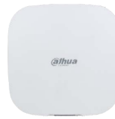
Hub di allarme